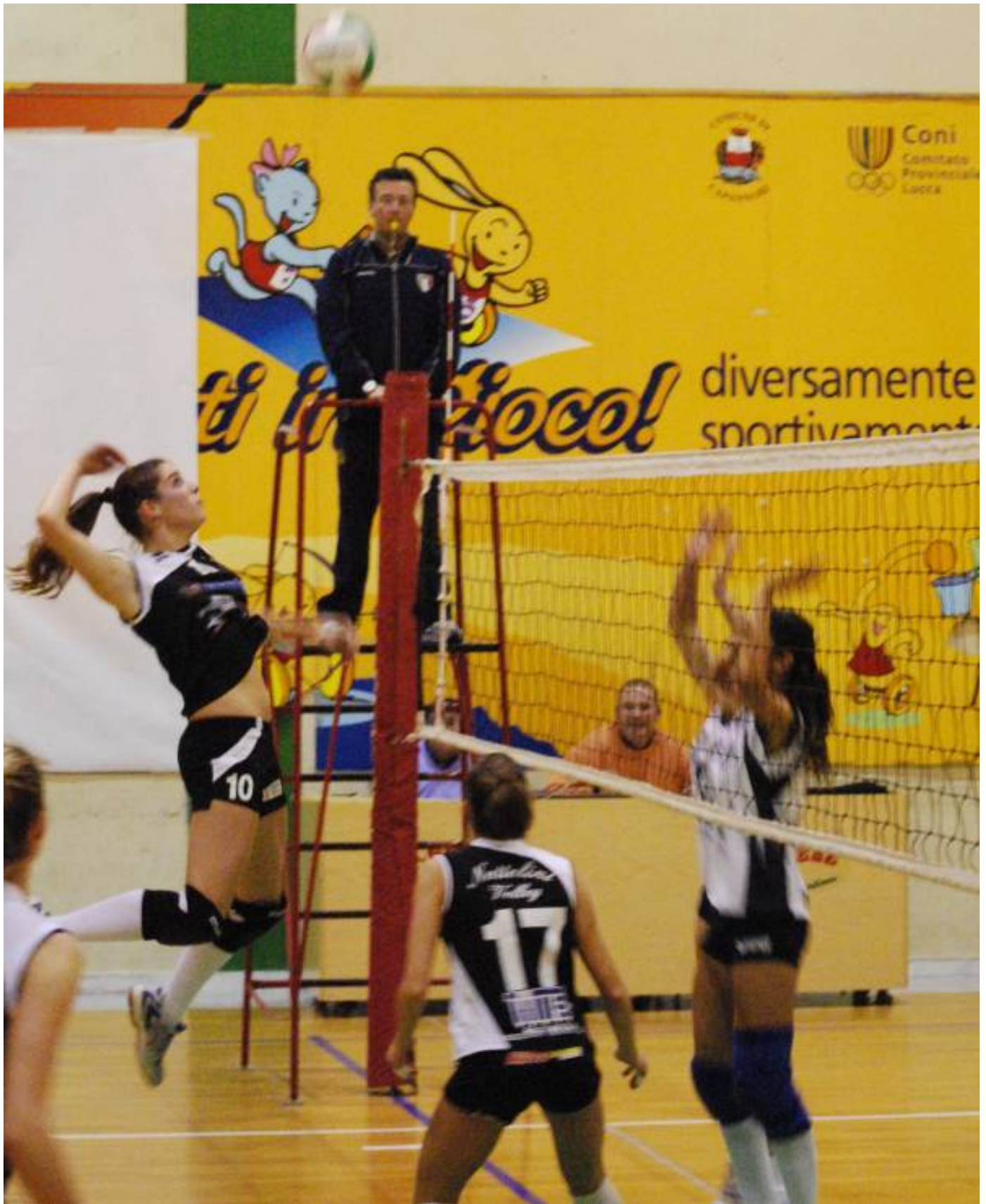
Un'immagine del derby dello scorso anno.