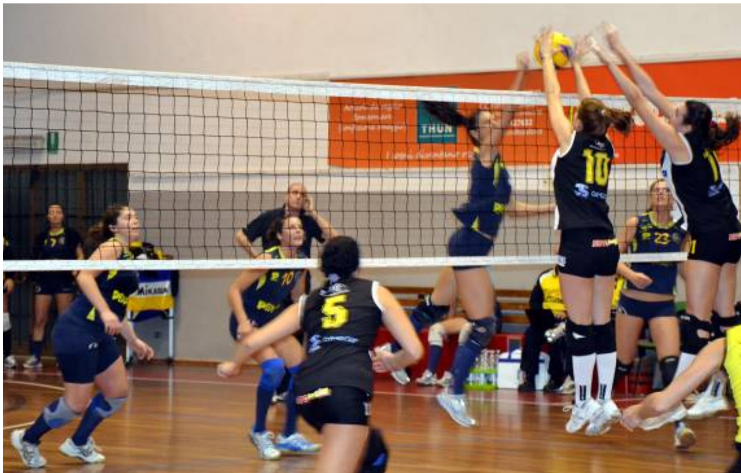
Una fase della partita di andata.