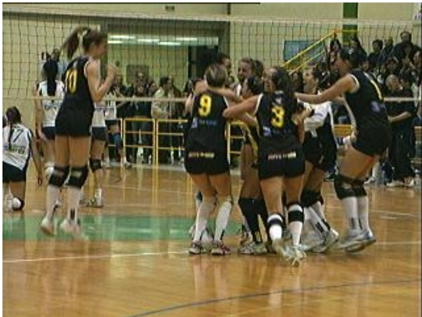
L'ultima palla e' a terra...e' B2.