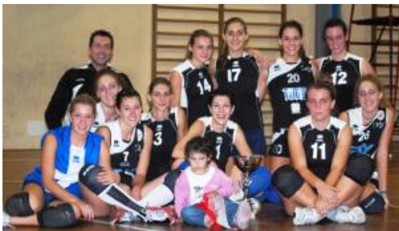
Foto fine torneo